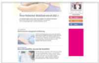
Vertical Rectangle 200 x 400 Pixel max. 40 kByte