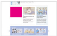
IAB Medium Rectangle 300 x 250 Pixel max. 40 kByte

* Für die mobile Auspielung vom Large Leaderboard können Sie uns einen Banner in 320 x 75 px; max. 40 kb zur Verfügung stellen.