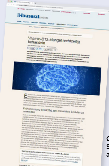
Online Streckenverlängerung aus Print